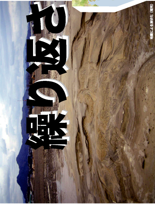
地震による浸食状況 (福岡)

詳細 (日本語版ホームページ) http://www.sediment.jp/ 「ふくおか市政だより」 8月15日号