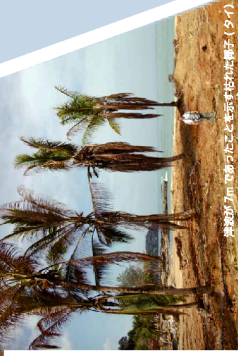
津波が3m以上高かったことを示す残った椰子(タイ)