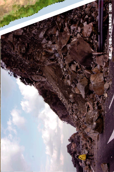
地震に起因する浸食した砂浜(鳥栖海岸) (福岡)