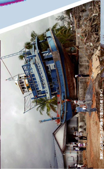
津波にLKD 600mほど移動した列島船は波に沈没 (タイ)